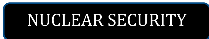
Kuva 5. Turvahenkilön työasuun kuuluvan päähineen merkintä

L105. Turvahenkilön työasuun kuuluvaan päähineeseen etupuolelle tai sivuille on tehtävä kuvan 5 mukainen merkintä taulukossa 1. esitettyihin vaatekappaleisiin. Teksti on toteutettava vähintään 8 mm korkuisin kirjaimin.