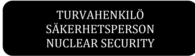
Kuva 3. Turvahenkilön työasun rintamuksen merkintä

L103. Turvahenkilön työasun rintamuksen vasemmalle puolelle on tehtävä kuvan 3 mukainen merkintä taulukossa 1. esitettyihin vaatekappaleisiin. Teksti on toteutettava vähintään 6 mm korkuisin kirjaimin.