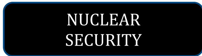
Kuva 4. Turvahenkilön työasun ja työasun päälle puettavan suojaliivin selkämyksen sekä suojakilven etuosan merkintä

L104. Turvahenkilön työasun ja työasun päälle puettavan suojaliivin selkämykseen sekä suojakilven etuosaan on tehtävä kuvan 4 mukainen merkintä taulukossa 1. esitettyihin vaatekappaleisiin ja suojavälineisiin. Teksti on toteutettava vähintään 40 mm korkuisin kirjaimin.